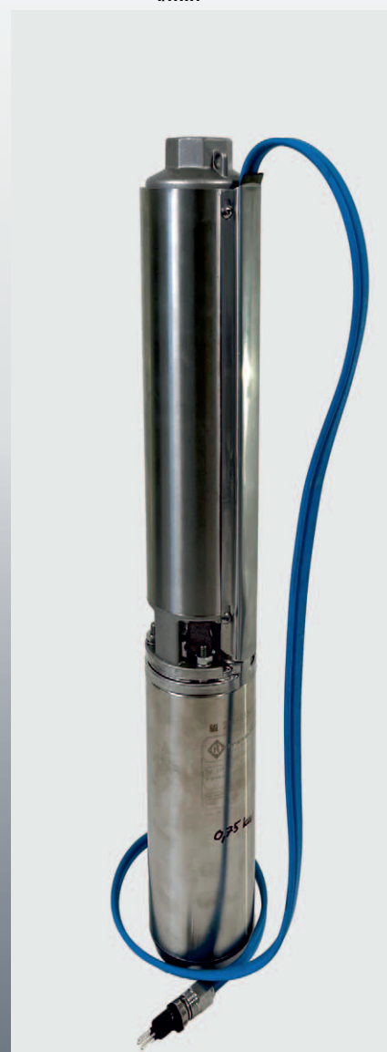
PGT 24" med Franklinmotor